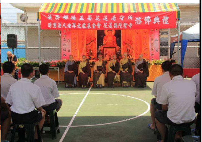
法師特別關心少年處境並予開示勉勵