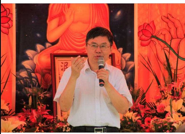
本所所長致辭感謝來賓並勉勵 收容人藉浴佛以洗心革面順利復歸