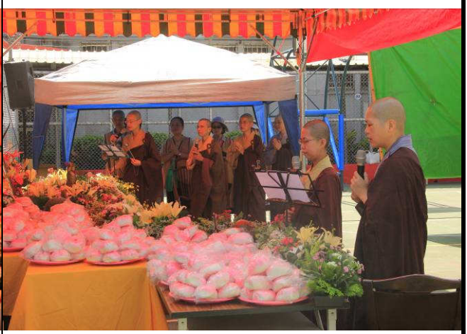
浴佛典禮唱誦祝禱莊嚴肅穆