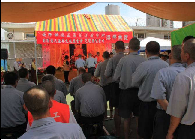
虔誠浴佛一心向佛 浴佛之後收容人表示心靈平靜許多