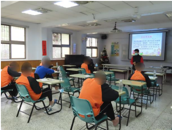
▲許老師講授家庭價值觀

12月1日、8日、15日、22日、29日9時至11時，辦理「科學實證之毒品犯處遇模式計畫」家庭支持方案—子職教育課程，由許老師講授家庭溝通型態、覺察少年自身情緒、生命故事影片分享主題探討，計有少年95人次參加。