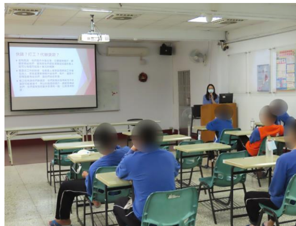
▲呼籲少年應遵守法律規範