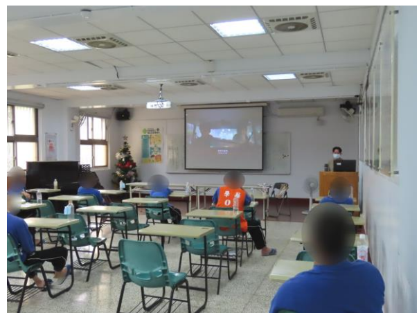
▲提醒少年應遵守社會規範