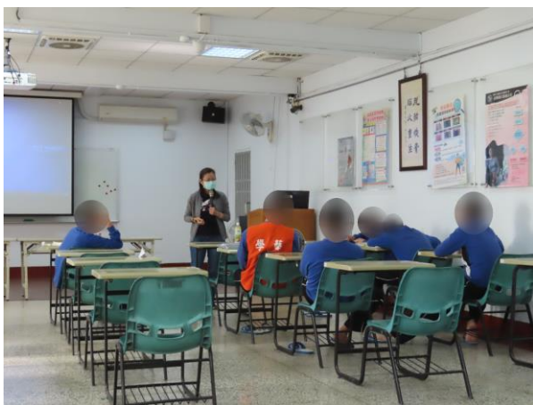
▲人生重大事件回顧

12月5日、12日、19日、26日09時至11時，與臺南市立醫院合作辦理「科學實證之毒品犯處遇模式計畫」—進行少年團體課程，邀請黃社工師入所授課，內容為目的VS代價、人生的分數、我的家庭等人生重大事件回顧等主題討論，計有少年76人次參加。