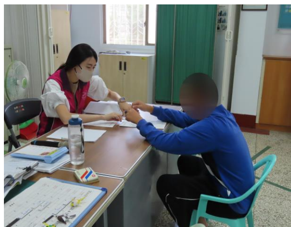
▲轉介毒品少年銜接輔導