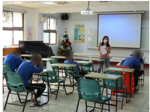
▲黃社工師與少年探討家庭狀況