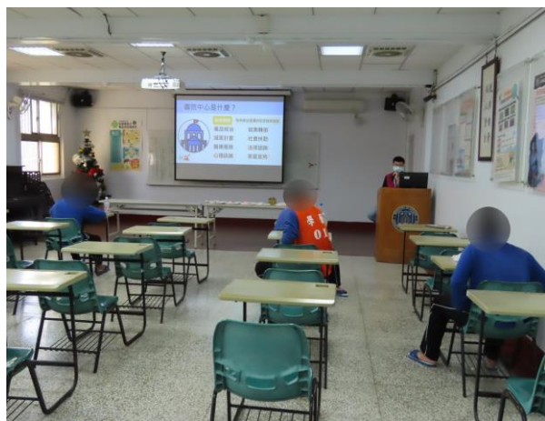
▲反毒及戒癮資源說明

12月8日14時至15時，由臺南市政府毒品危害防制中心三位黃個管師及詹個管師、王個管師入所進行該中心服務介紹；內容為新興毒品反毒宣導、戒癮資源說明、轉介毒品少年銜接輔導，計有少年20人次參加。