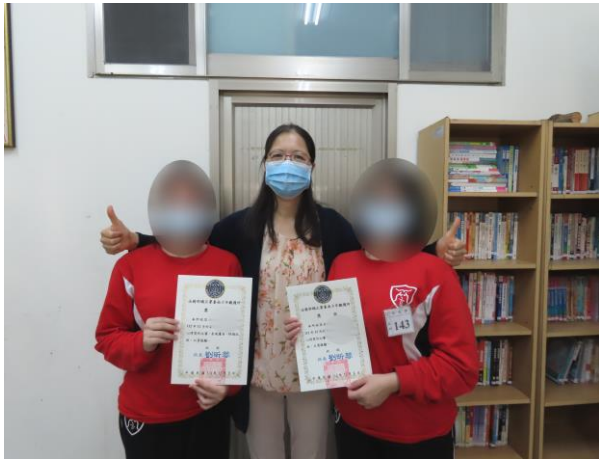
▲所長頒發獎狀予獲獎少年

與社團法人臺南市觀護協會合作協助本所推動「閱讀悅好」活動，於每週進行閱讀書籍心得撰寫，錄取得名少年可獲得該協會捐贈之參佰元獎學金，並由所長公開表揚頒發獎狀，少年可透過閱讀增廣見聞、開拓視野，並且有益身心靈健康發展，本月計有少年 58 人次參加。