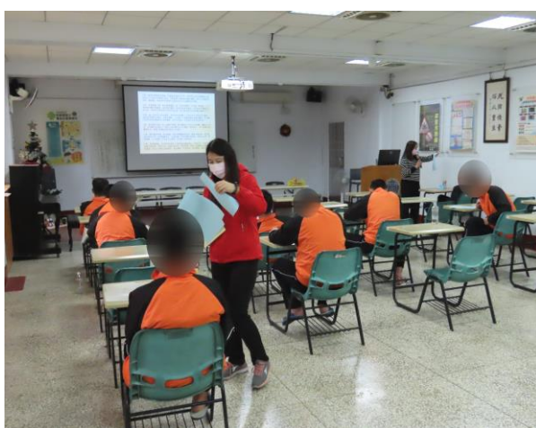
▲協助少年職業興趣探索