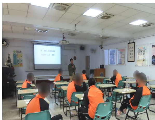
▲勉勵少年應正向自我肯定