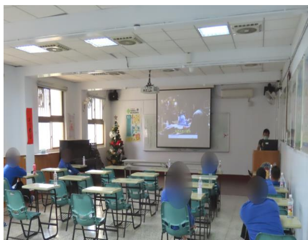
▲未來展望影片分享討論