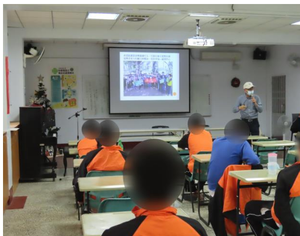
▲勉勵少年應行善助人