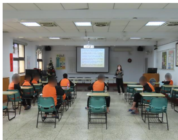
▲就業服務中心業務宣導

12月28日14時至15時，邀請就業服務中心陳、林二位就業服務員分別進行就業服務宣導，提供該中心服務說明、人格特質解說、職業興趣探索等宣導，計有少年19人次參加。