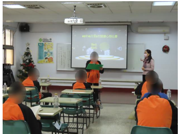
▲獲獎少年心得分享